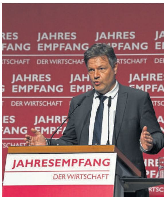
Vizekanzler und Bundesminister der Wirtschaft und Klimaschutz Robert Habeck

Spekulationen über künstliche Intelligenz sowie ihre Auswirkungen auf die verschiedenen Bereiche des Wirtschaftslebens prägen nach wie vor die Debatte. Belastbare Erkenntnisse sind bislang naturgemäß rar, was die Diskussionen nicht eben vereinfacht. Sicher ist allerdings, dass es bereits heute ethische und rechtliche Grenzen für den Einsatz künstlicher Intelligenz gibt. Unser Grundgesetz bestimmt, dass die Rechtsprechung unabhängigen Richtern, also Menschen anvertraut ist. Künstliche Intelligenz kann in diesem Bereich also äußerstenfalls der Unterstützung des Menschen dienen, darf ihn aber nach dem Willen des Gesetzgebers nicht ersetzen. Den Rechtsanwälten weist das Gesetz die Stellung von Organen der Rechtspflege zu, sieht sie also als Teil des Prozesses, der zur Rechtsprechung durch die Gerichte führt. Damit steht zugleich fest, dass auch der Rechtsanwalt in Zu-