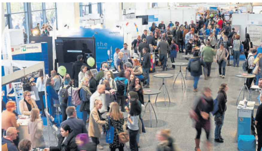
Pflegeforum RLP 2023 in der Rheingoldhalle Mainz

kämpfen auch andere Wirtschaftszweige um die immer knapper werdenden Ressourcen. In diesem komplexen Umfeld ist die Landespflegekammer Rheinland-Pfalz in zahlreichen Gre-