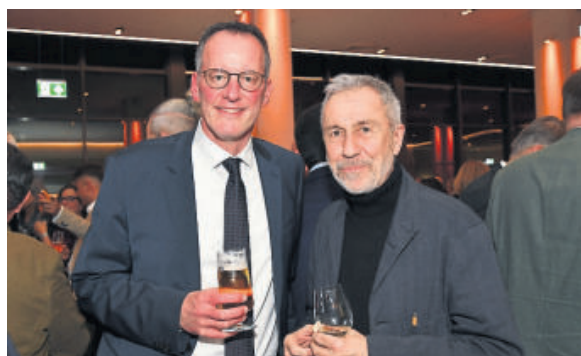
Zeit zum Austausch mit Innenminister Michael Ebling (SPD), Mitglied des Landtags, in entspannter Atmosphäre.

Die Förderung der Baukultur, des Bauwesens, der Landschaftspflege und der städtebaulichen Entwicklung gehören zum gesetzlichen Auftrag der Architektenkammer Rheinland-Pfalz. Sie vertritt die berufspolitischen Interessen ihrer rund 5.800 Mitglieder und bietet alle Services der Selbstverwaltung sowie Beratung an.