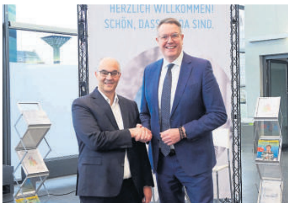
Dr. Markus Mai, Präsident der Landespflegekammer RLP und Staatsminister Alexander Schweitzer

mien aktiv und vertritt die Interessen sowohl der Pflegeempfänger als auch der beruflich Pflegenden im Land. Die Pflege hat nun einen festen Platz, und ihre Positionen können nicht mehr ignoriert werden. Zusätzlich sucht die Pflegekammer kontinuierlich nach Möglichkeiten, sich in Politik und Gesellschaft zu vernetzen. Aktiv arbeitet sie beispielsweise mit anderen starken Partnern in der Fachkräfte- und Qualifizierungsinitiative 2.1 des Landes Rheinland-